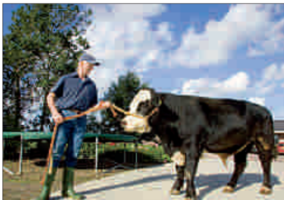
Van der Hulst maakt gebruik van natuurlijke dekking. Door elk jaar een nieuwe stier in te zetten, wordt inteelt voorkomen.