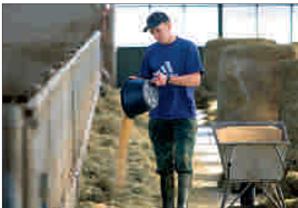
Door de arme grond op het voormalige akkerbouwbedrijf zijn de gehalten wat gezakt. Daarom voeren de ondernemers soja bij.

ductie en opbrengstprijs van het vee vallen op Zeeoogst gunstig uit. De hogere veeprijs is te verklaren doordat de ondernemers zijn uitgegaan van de meest recente vee prijzen en de andere kolommen