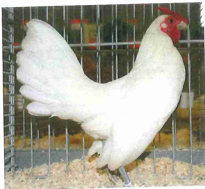
Eikenburger en rechtsboven een Sebright.

Nederland heeft een omvangrijke collectie zeldzame inheemse kippenrassen en elk ras heeft z'n eigen uiterlijke kenmerken. Deze Nederlandse kippenrassen werden naast het 'mooi' ook gehouden voor de ei- en vleesproductie. Na de Tweede Wereldoorlog kreeg de zorg voor goed en betaalbaar voedsel een hoge prioriteit en dit zorgde voor een voortgaande efficiency en specialisatie in de pluimveesector. Hierdoor werd het aantal kippen van Nederlandse rassen gemarginaliseerd en worden ze nu alleen door sport- en hobbyfokkers gehouden. Deze fokkers zorgen voor het behoud van de variëteit aan rassen. Deze